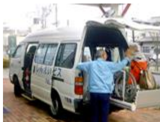
リフト付き送迎車両あり