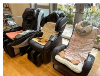
マッサージチェアを設置